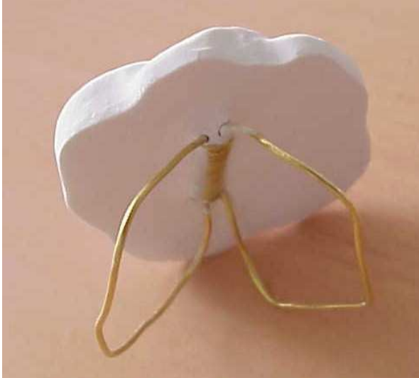
gros plan sur l'attache foulard « maison »

Préparer le plâtre suivant le mode d'emploi, mais un peu liquide. Passer le moule sous l'eau additionnée d'une goutte de produit vaisselle (ça facilite le démoulage) : le secouer pour enlever les gouttes. Couler le plâtre dans le moule.