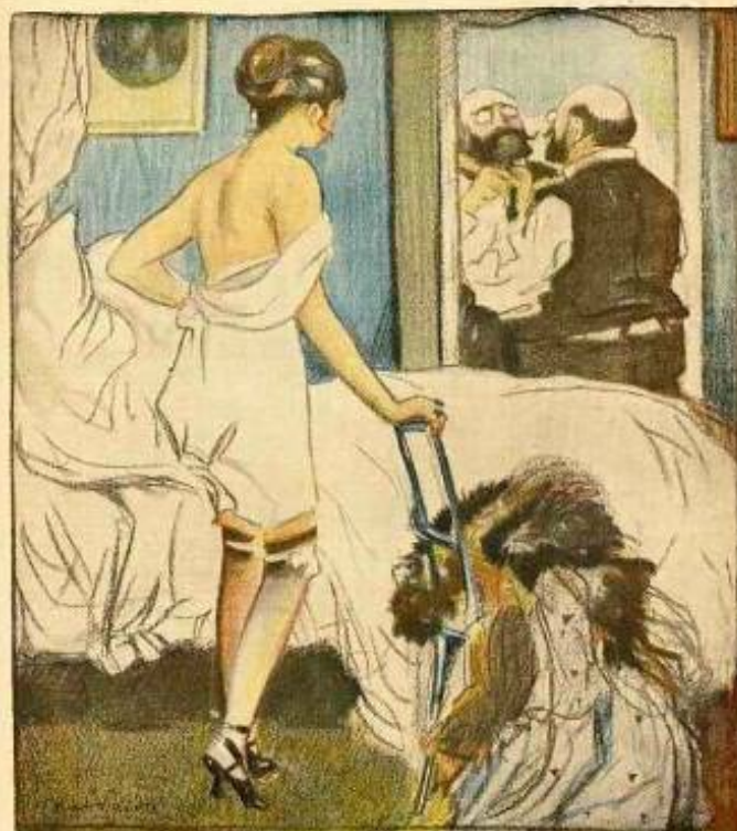
— C'est pas drôle d'être Commissaire aux Armées : on n'a même pas de draps en tête.

Propriété de la Société d'Éditions 11, rue de Valenciennes, PARIS