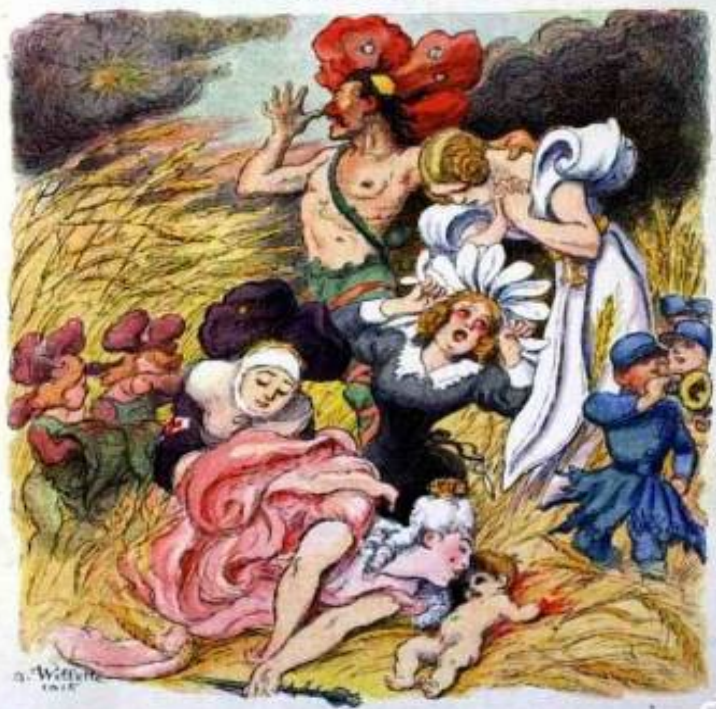
Les belles et les beaux sont aussi les victimes de la fauché allemande.