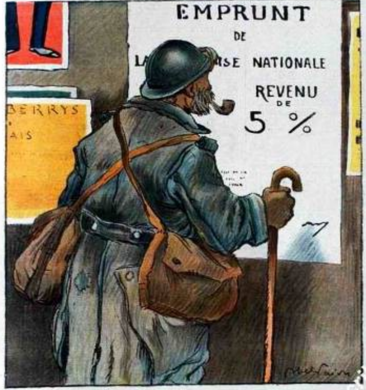
— Moi, je restais de bien plus loin.

Propriété de la Société d'Éditions 11, rue de Valenciennes, PARIS