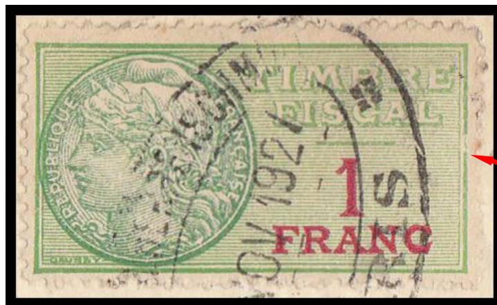
Dénomination de la variété : NE – Cad – Petite virgule

Voici maintenant d'autres variétés dont je ne sais pas, mais je le présume, s'il s'agit de variétés constantes. Il faudrait donc trouver d'autres timbres identiques pour se prononcer définitivement :