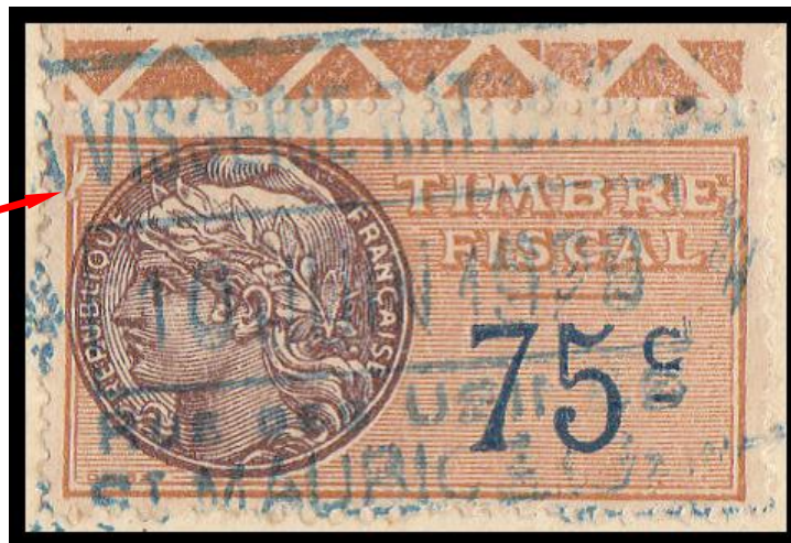
Dénomination de la variété : NO – Cad – Brisure