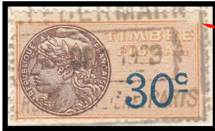
Dénomination de la variété : NE – Cad – Angle brisé