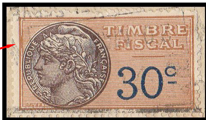
Dénomination de la variété : NO – Cad – Cadre bouché