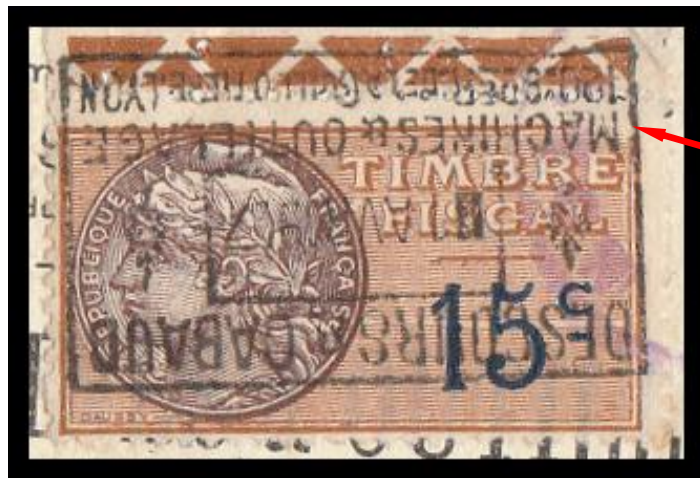
Dénomination de la variété : NE – Cad – Angle brisé

Ici aussi, il s'agit a priori, de la même variété .