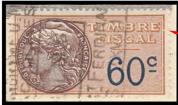
Dénomination de la variété : NE – Cad – Brisure