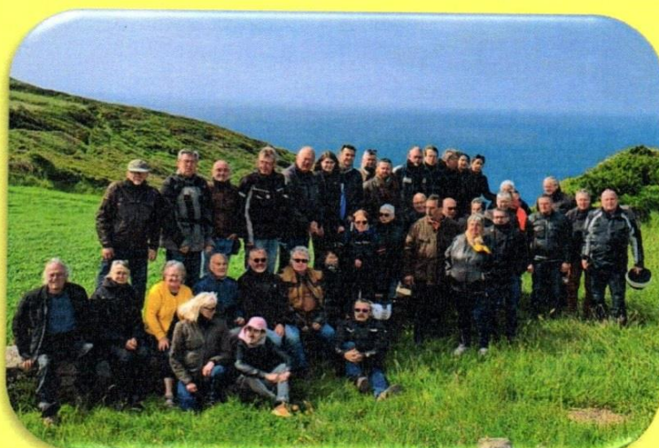
Sortie des Vieux Pistons dans la Hague- Mai 2023

Blog : http://motosanciennes.canalblog.com