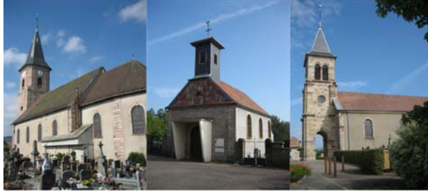
Lachapelle sous Chaux et Sermamagny (St Vincent) - Errevet (St Lin) - Evette-Salbert (St Claude)