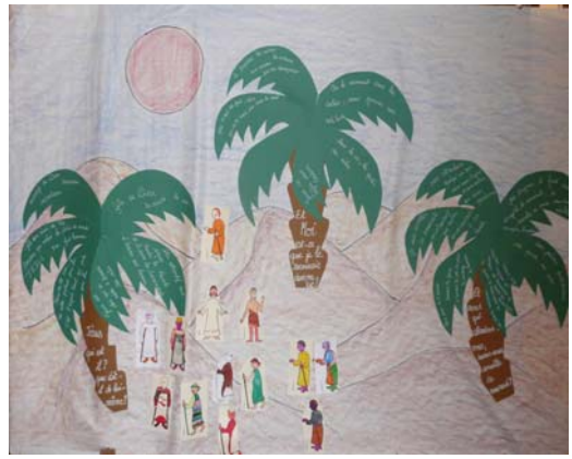
Fresque réalisée par les enfants