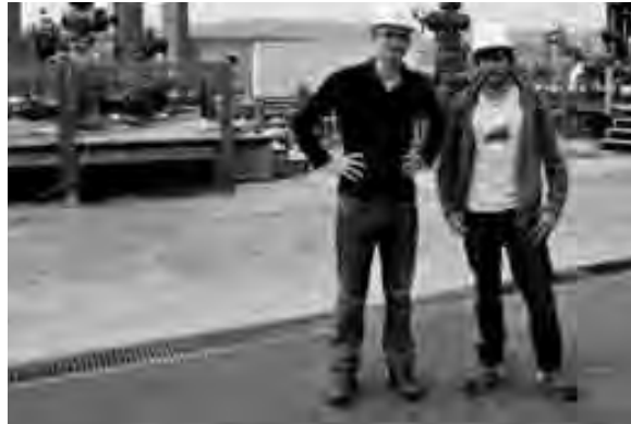
▲ Les vagabonds de l'énergie à la centrale géothermique de Soultz-sous-Forêts, Alsace.