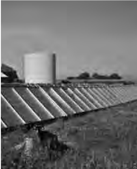
nal, Samsø, Danemark.