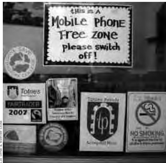
▲ Vitrine du Willow, café-restaurant végétarien à Totnes : livres de Totnes acceptés.

militants et de citoyens préoccupés de l'avenir de leur ville, et plus généralement de l'avenir de nos sociétés, face au double choc du pic du pétrole et du changement climatique. Dans un pays qui importe de l'énergie et 80 % de sa nourriture, comment continuer à se nourrir, se chauffer, s'habiller et se déplacer, lorsque le pétrole viendra à manquer ? Le premier objectif de TTT est d'organiser régulièrement des conférences et des débats dans de nouveaux lieux, pour amener un maximum de