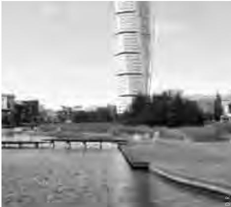
version d'une exposition universelle comme "durable".