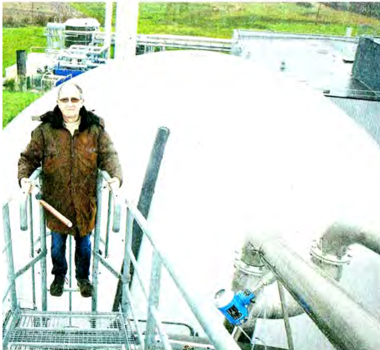
Installation de lisier Geotexia, à Saint-Gilles-du-Méné, le 21 mars.