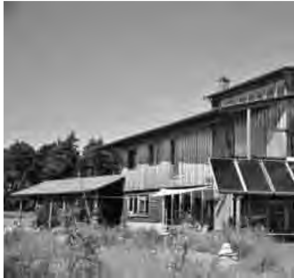
▲ Maison de l'écovillage de Sieben Linden, Allemagne.

comme celle que nous avons visitée à Baden Baden (Allemagne) et une autre quelconque industrie. De plus la mise en place de ces réseaux de chaleur permet de raccorder d'autres sources plus inattendues. A Helsinki (Finlande), les circuits de refroidissement des serveurs informatiques sont raccordés au réseau de chauffage. En procédant ainsi, on économise d'autant la quantité d'électricité ou d'énergie fossile nécessaire pour nous chauffer (et celle nécessaire pour refroidir les serveurs).