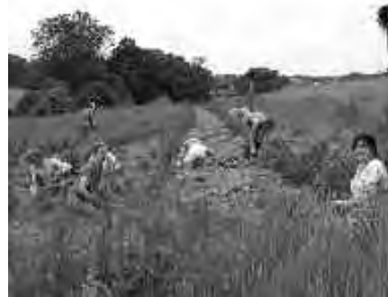
◀ Plantations d'un à Emerson, autor.

Doctorants en socio-anthropologie de l'environnement, au Cetcopra (Centre d'étude des techniques, des connaissances et des pratiques, Paris 1-Panthéon-Sorbonne), les auteurs travaillent sur les stratégies de sobriété collective comme réponse à l'urgence écologique.