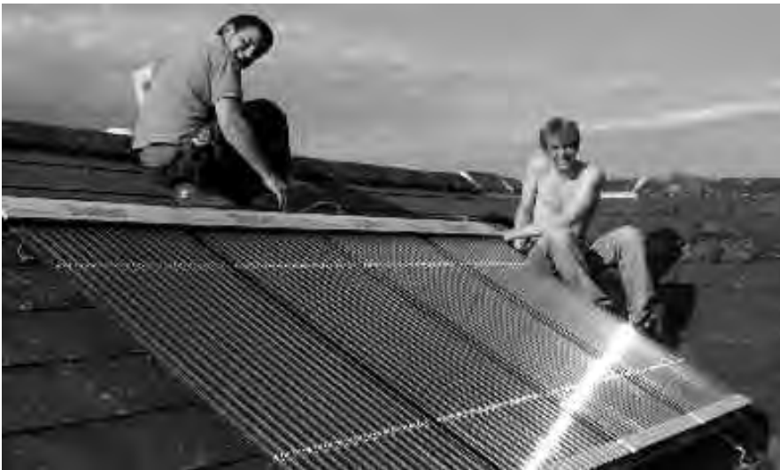
Silence n° 365 février 2009

Aujourd'hui, plus de 70 commerces locaux indiquent, par un autocollant sur leur vitrine, qu'ils acceptent la livre de Totnes. Une fois cet argent encaissé, certains viennent l'échanger contre des livres britanniques au bureau de TTT, mais d'autres jouent le jeu en réinjectant les livres de Totnes dans l'économie locale : pour se fournir