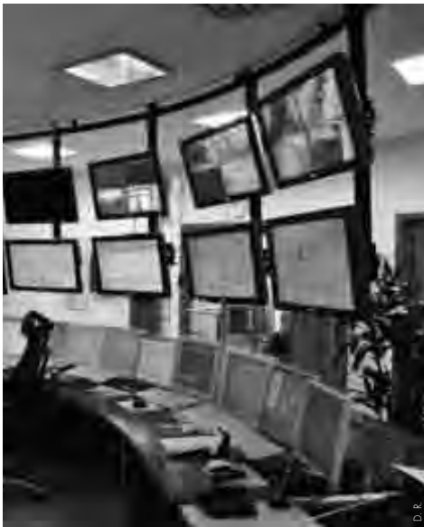
▲ Salle de contrôle de l'incinérateur de Trondheim, Norvège. Fournit de la chaleur au réseau de chauffage urbain. Dans plusieurs pays, l'incinération de déchets est considérée comme