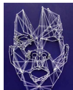
Chant des Ourses