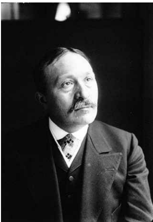
René Viviani (1863-1925), 1912 Photographie négative sur verre

Photographie argentique (Nicolas II)