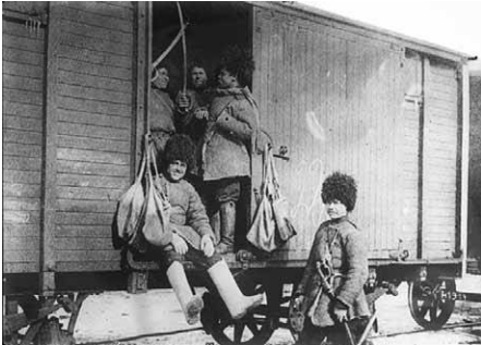
Cosaques partant à la frontière.

Après avoir signé la mobilisation générale à midi, Nicolas II l'annule en soirée, puis décide une mobilisation partielle dirigée contre l'Autriche-Hongrie, et suggère un télégramme à Guillaume II de recourir à l'arbitrage de la Cour de La Haye pour résoudre le conflit austro-serbe.