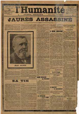
Une du grand journal socialiste L'Humanité sur l'assassinat de Jaurès, son fondateur et directeur.

Les ordres de mobilisation générale en France et en Allemagne sont donnés dans l'après-midi, et l'Allemagne déclare la guerre à la Russie dans la soirée. En France, dans une volonté d'apaisement des esprits, le gouvernement décide de ne pas arrêter les personnalités antimilitaristes susceptibles de gêner la mobilisation, recensées dans le célèbre carnet B.