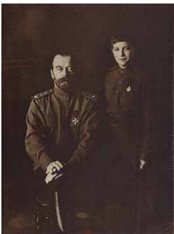
Nicolas II et le tsarévitch en tenues militaires, vers 1916.

« Une guerre honteuse a été déclarée à une faible nation : je partage entièrement l'indignation qui est immense en Russie. Je prévois que très prochainement je ne pourrai plus longtemps résister à la pression qui est exercée sur moi et que je serai forcé de prendre des mesures qui conduiront à la guerre. Pour prévenir le malheur que serait une guerre européenne, je te prie, au nom de notre vieille amitié, de faire tout ce qui sera possible pour empêcher ton alliée d'aller trop loin. »