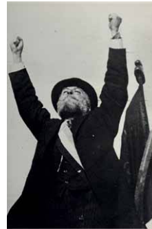
Jean Jaurès en meeting, vers 1910.

L'Allemagne proclame « l'état de guerre menaçant » en réaction à la mobilisation générale (stopper la mobilisation) et à la France (préciser ses intentions en cas de conflit germano-russe). Si la France choisit la neutralité, elle doit livrer en gage les forteresses de Toul et de Verdun.