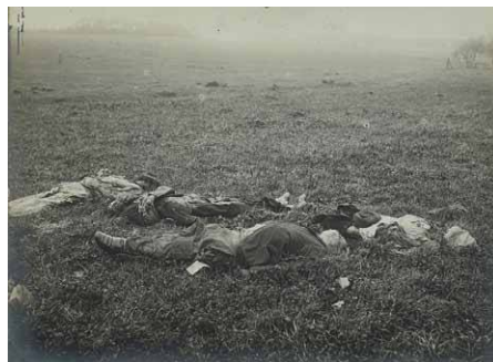
Cadavres de civils fusillés au lieu-dit La Prêle, Gerbéviller (54), septembre 1914.

Les mois d'août et de septembre sont les plus meurtriers de la guerre notamment pour les officiers : les armées d'infanterie s'affrontent à découvert et sont fauchées par les mitrailleuses. Les soldats s'enterrent ensuite dans des tranchées, le long d'un front stable. La guerre de mouvement ne reprend qu'au printemps 1918.