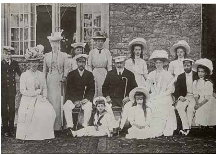
Familles royales d'Angleterre et de Russie, Nicolas II et Edouard VII (père de Georges V). Cette image de la sociabilité estivale de familles régnantes évoque aussi le rapprochement entre la Grande-Bretagne et la Russie au sein de la Triple-Entente conclue en 1907.

Mais les systèmes d'alliance permettent à l'Autriche-Hongrie et à la Russie de prendre des initiatives risquées sans avvertir ouvertement leurs alliés. Le tsar Nicolas II est soumis à la pression de son entourage et commence à préparer la mobilisation. Le 26 juillet, il prend des mesures de pré-mobilisation, devant l'obstination de l'Autriche à menacer la Serbie, qui n'a, de son côté, accepté que partiellement de se soumettre à l'ultimatum, refusant de céder aux exigences autrichiennes qui empiètent sur sa souveraineté.