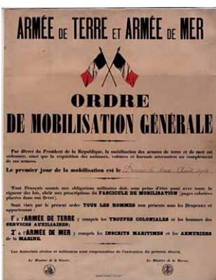
« Armée de terre et armée de mer. Ordre de mobilisation générale », dimanche 2 août 1914.