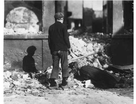
Les civils sont rapidement touchés : pendant l'invasion allemande de la Belgique et du nord de la France, certains obus de longue portée touchent les villes que les populations n'ont pas eu le temps ou la possibilité d'évacuer. Les habitants des zones occupées sont soumis à des conditions de vie très éprouvantes.

La Belgique rejette l'ultimatum allemand dans la matinée du 3 août, et dans la soirée, l'Allemagne déclare la guerre à la France alléguant le bombardement de plusieurs villes allemandes par l'aviation française. Les Allemands entrent en Belgique. L'Italie, alliée théorique de l'Allemagne et de l'Autriche-Hongrie, déclare sa neutralité.