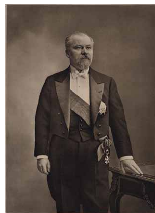
Raymond Poincaré (1860-1934), président de la République de 1913 à 1920. Il pousse au resserrement des alliances et à la fermeté contre l'Allemagne, plus soucieux d'entrer dans le conflit dans de bonnes conditions que de maintenir la paix.

« ... Jamais une déclaration de guerre n'a été accueillie avec une telle satisfaction. La France ayant fait tout ce qui dépendait d'elle pour maintenir la paix et la guerre étant devenue inévitable, mieux valait cent fois que nous ne fussions pas amenés, même par la violation réitérée de notre frontière, à la déclarer nous-mêmes. »