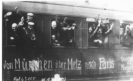
Caractéristiques des premiers jours de la mobilisation, ces images (posées pour des agences de presse) ont pu donner l'impression que tous les soldats portaient « la fleur au fusil », alors que chez la majorité d'entre eux et dans tous les pays belligérants la résignation domine.

L'armée allemande entre au Luxembourg et la Belgique rejette l'ultimatum allemand dans la matinée du 3 août, et dans la soirée, l'Allemagne déclare la guerre à la France alléguant le bombardement de plusieurs villes allemandes par l'aviation française. Les Allemands entrent en Belgique. L'Italie, alliée théorique de l'Allemagne et de l'Autriche-Hongrie, déclare sa neutralité.