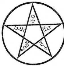
ancien horoscope ... et ... pentacle magique

"Leon VI, fils & successeur de l'empereur Basile (vers 900), fut surnommé le Philosophe , quoique ses mœurs dissolues le rendissent indigne de porter un si beau nom.