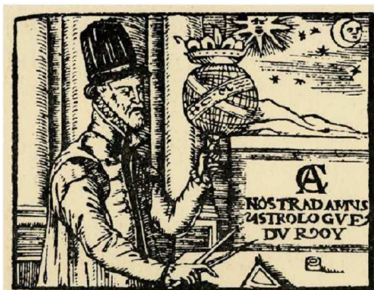
Nostradamus, astrologue du roi, bois du XVI ème siècle

Nostradamus, on l'a vu, établissait des almanachs, puis ses prophéties, en se basant essentiellement sur l'astrologie, c'est-à-dire l'observation des astres.