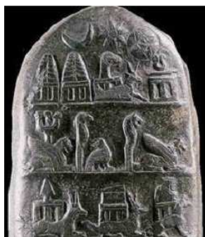
stèle mésopotamienne XII ème siècle av. J. C.

Et pourtant, des documents astrologiques mésopotamiens distincts des inscriptions astronomiques remontent au II ème millénaire av. J.C. et en 605 av. J.C., l'enseignement de Thalès à Milet marquait déjà le début d'une astronomie distincte de l'astrologie !