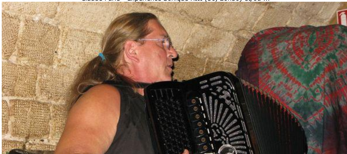
The Fish (30, 18h30) - Pierre Chinellato