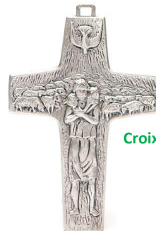
Croix du bon berger du pape François

☺ Choisir d'être au service des autres, choisir de m'engager, choisir d'être fidèle à mes promesses