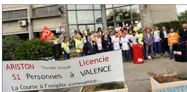
Les 51 salariés de STV France (Ariston Thermogroup) restent mobilisés et devraient faire parler d'eux ce week-end.