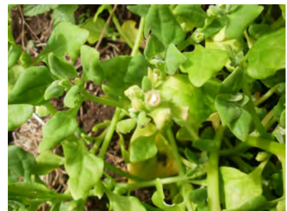
Tétragone en graines