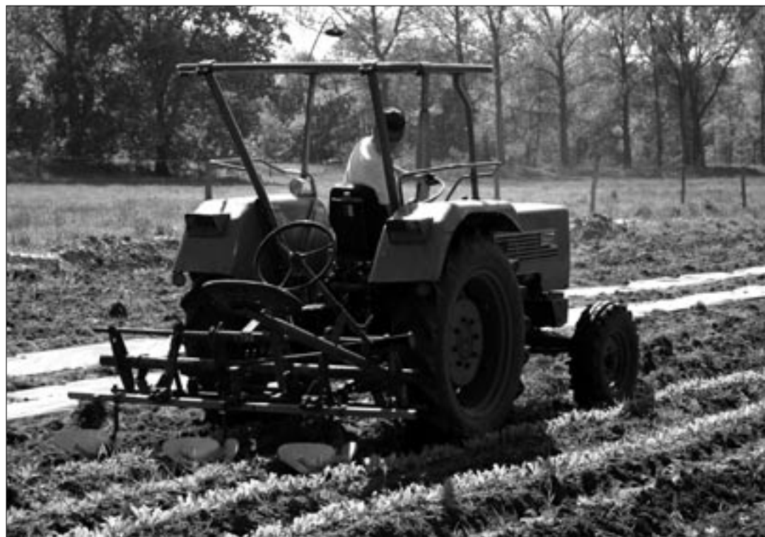
«L'expérience de participer à ce processus naturel de la production alimentaire donne une grande satisfaction à chacun.»

Pour le raffinement des desserts, il y a un pesto sucré à la mélisse, aux amandes et à l'huile de tournesol.