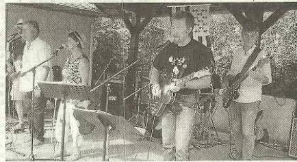
Un préau a été transformé en scène pour des groupes comme Alamasse.