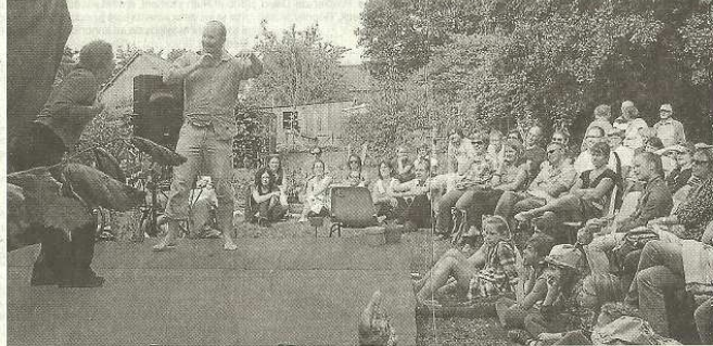
Le spectacle de théâtre d'improvisation a offert un bon moment de détente en pleine nature.

Dans une prairie, les spectateurs se sont régalez avec du théâtre d'improvisation. Les enfants sont restés bêtés devant les tours du magicien ou ont suivi le mime qui distribuait des bonbons. Ils pouvaient également se faire maquiller ou avoir un chapeau réalisé en papier kraft. Les artistes en herbe ont aussi été invités à réaliser une fresque.