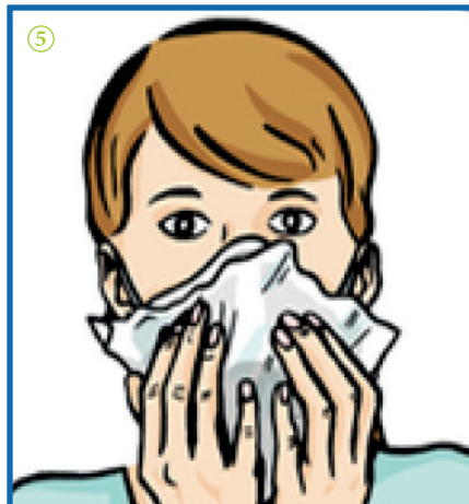
⑤ Tester l'étanchéité : couvrir le masque avec une feuille en plastique et inspirer, le masque doit se plaquer contre le visage.