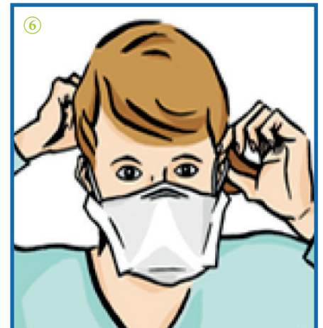
⑥ Après usage, retirer le masque par les élastiques.

- Le masque est à changer immédiatement dès qu'il est mouillé, souillé ou mal positionné sur le visage : une fois enlevé, il ne doit pas être réutilisé.