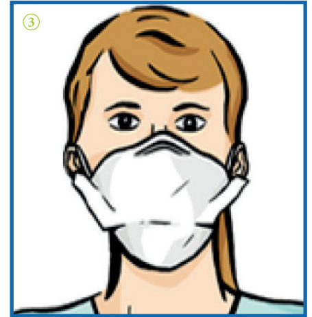
③ Vérifier que le masque couvre bien le menton.