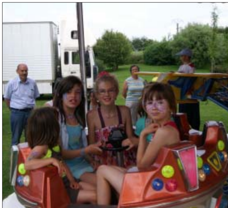
Le manège enfantin connaît toujours un vif succès surtout quand les tours sont gratuits !