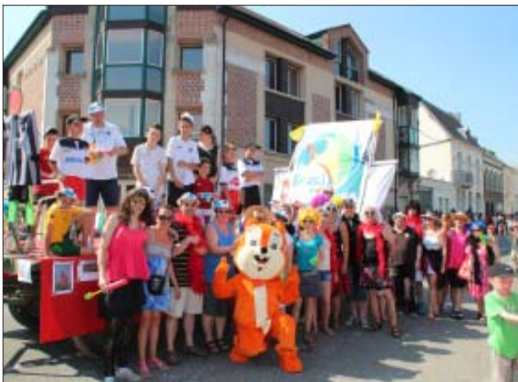
Le char des footballeurs, qui avaient choisi le thème du Brésil, lors de cette ducasse 2013.

Samedi, sous un soleil radieux, cent quarante-cinq brocanteurs installèrent leurs étals sur les trottoirs. Dimanche, à 15 h 30 débuta le défilé carnavalesque pour terminer trois jours de fête. En tête du défilé on trouvait les musiciens de la fanfare La Joyeuse Banda tous vêtus de blanc et de rouge. Après un parcours de 2 km effectué sous un soleil brulant, tous avaient bien mérité une récompense et ils se retrouvèrent tous à la salle des fêtes pour les chouquettes et le pot de l'amitié. ■