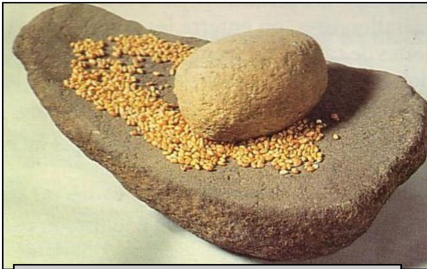
Doc t 1 : Meule à main en pierre, 4 000 à 3 000 av. J.C. - Bretagne