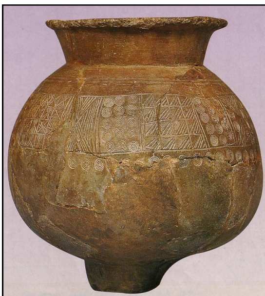
Doc t 4 : Poterie - 2 000 à 750 av. J.C. - Grotte de Rancogne ; Poitou Charente