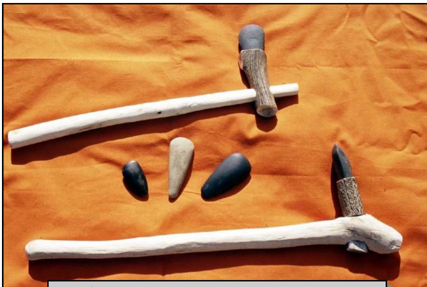
Doc t 3 : Haches polies en pierre ; 5 000 à 2 000 av. J.C. http://www.cheminsdelamemoire.net/

[...] L'élevage du bétail - moutons et chèvres, inconnus à l'état sauvage en Europe et importés du Proche-Orient : bœufs et porcs, peut-être d'origine locale pour certains - fournit dans un premier temps uniquement de la viande de boucherie. Par la suite, on apprend à exploiter ces animaux pour leur lait, leur laine ou leur force de traction.