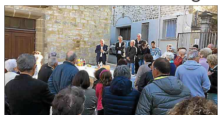
■ Lors de l'inauguration, vendredi dernier.

Le vernissage de l'exposition de photos "Moussac hier et aujourd'hui" a eu lieu vendredi soir à 18 heures au temple en présence de Frédéric Salle-Lagarde, maire, et de Fabrice Verdier, député. Cette exposition se prolongera jusqu'au 7 mai (de 10 heures à 12 heures et de 14 heures à 18 heures). Elle permet de redécouvrir l'histoire de ce village au-dessus du Gardon : l'activité viticole, la fermeture industrielle de la Réglièrie, qui avait donné du travail à beaucoup de ses habitants, l'école et sa fête qui rassemblait tout le village,