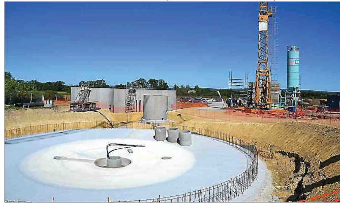
■ La station intercommunale de traitement des eaux est actuellement en chantier.

Six habitants ont en effet déposé un recours auprès du tribunal administratif de Nîmes. Il s'agit d'une requête en annulation partielle de l'arrêté préfectoral du 20 novembre 2014, déposée juste avant la fin du délai de recours, le 9 novembre 2015. La requête porte plus précisément sur les articles 2 et 4 de l'arrêté préfectoral. L'article 2 précise que le rejet s'effectue dans un fossé communal puis dans la rivière Bourdic, affluent du Gardon. Mais les requérants estiment que les rejets s'effectuent en fait « dans un fossé communal puis dans un bras mort du Bourdic, qui est l'ancien bief aval du moulin de Fantaisie, une propriété privée. Ce qui, pour nous, est contraire à l'arrêté du 22 juin 2007 précisant que les rejets d'eaux usées doivent être effectués dans le lit mineur du cours d'eau, à l'exception de ses bras morts ».