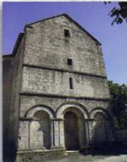
Un village fort sympathique : Voulgézac