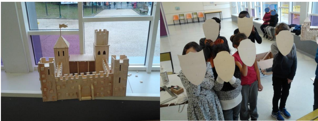
Quand on me demande un château... oui mais quel château ? Quelle forme ? Quelle époque ? Quel style ?