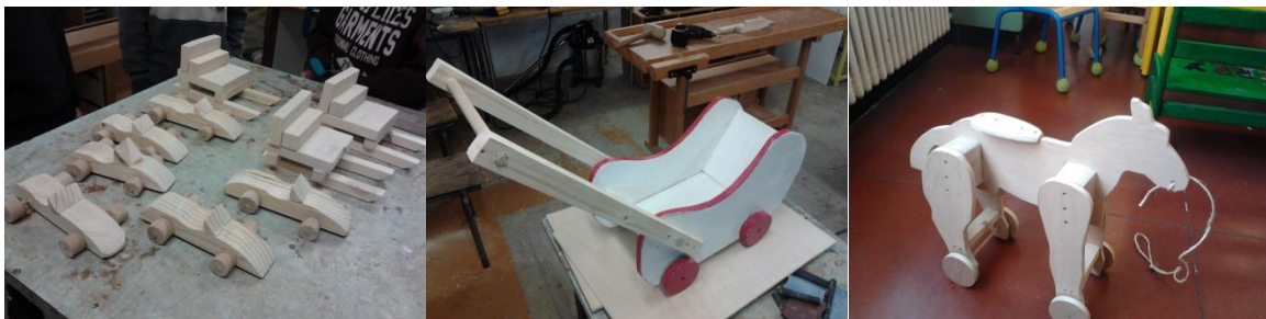
Pendant les vacances : voitures de course, traîneaux, poussettes, chevaux .... Cavaliers ? avion-chaïse portable ?