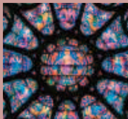
CONCERT DE LA GRANDE ROSACE SAM 22 MARS 14

ENTRÉE LIBRE /// INFOS 03 26 35 61 27 / WWW.CRR-REIMS.FR