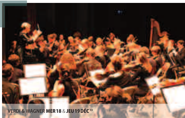
VERDI & WAGNER MER 18 & JEU 19 DÉC 13

ENTRÉE LIBRE /// INFOS 03 26 35 61 27 / WWW.CRR-REIMS.FR