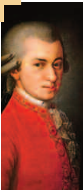
Wolfgang-amadeus-mozart by Barbara Krafft (1764 - 1825)