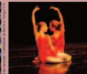
SPECTACLES DE DANSE DU VEN 28 AU SAM 5 AVR 14