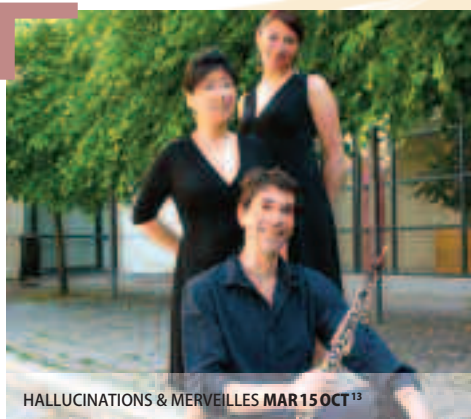
HALLUCINATIONS & MERVEILLES MAR 15 OCT 13