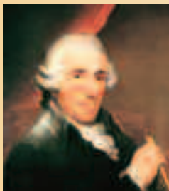
PAPA HAYDN MER 19 FÉV 14

Joseph Haydn / Portrait de T. Hardy (1792), huile sur toile, © 2007 Royal College of Music, Gift of Mr Arthur Hill, 1933