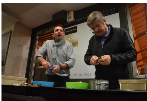
Interloqué le manager ...