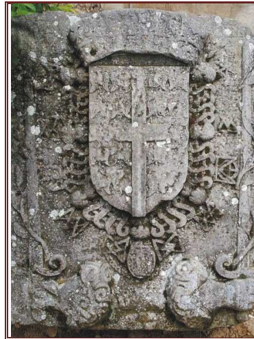
Blason des Montmorency

Sources : J.DEPOIN Famille de MONTMORENCY – Mes recherches généalogiques sur cette famille aux diverses branches.