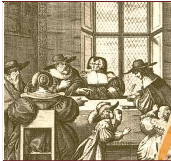
Le Notaire rédigeant devant la famille...