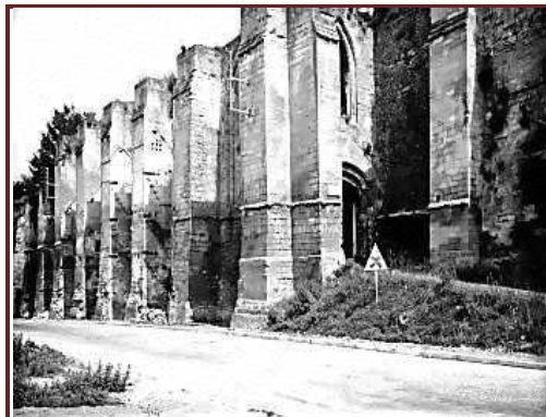
Ruines de l'abbaye de Beaumont le Roger (Eure)

Roger de BEAUMONT fit ériger à MEULAN un superbe castel dont certains restes peuvent encore se voir sur les murs des circonvolutions qui entourent la colline Saint-Nicolas derrière la résidence des Pénitents. Sur la fin de sa vie il se retira à l'abbaye de Préaux où loin du bruit et des armes du monde et certainement loin des intrigues qui parsemèrent sa carrière, il mourut le 20 novembre 1094 revêtu de l'habit monastique. Il est enseveli dans l'église du monastère à côté de son frère aîné Robert de Beaumont tué en combat singulier par Roger de TOËSNY.