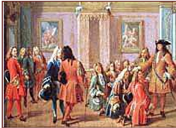
Les valets de la Garde-robe du Roi

Sources : AD 78 Chronique St Nicaise (H 24)