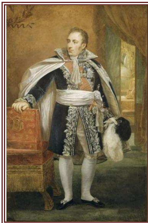
Pierre Antoine Noël Bruno de DARU Baron d'Empire

La ville de MEULAN possède plusieurs lettres autographes du comte de DARU dans ses archives. Son fils Napoléon DARU, ancien député de la Manche, ancien Ministre et sénateur devint à la mort de son père : propriétaire du château de Bècheville (1838).