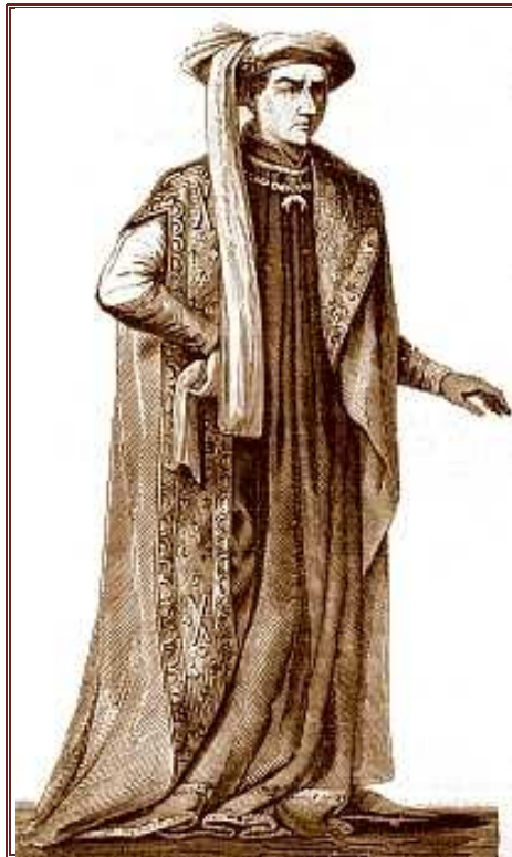
Procureur conseiller du roi du 15 ème siècle

Il était en outre Conseiller de la Reine parce que Catherine de Médicis possédait alors le comté de MEULAN en douaire et avait été député de son bailliage aux états-généraux tenus à Orléans en 1560.