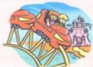
Nombre de visiteurs durant les jours d'ouverture du parc d'attractions

→ Le mercredi et le samedi, le parc a accueilli 640 visiteurs.