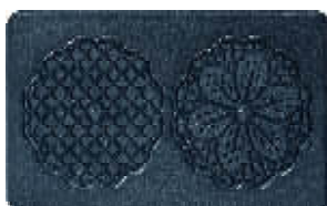
Plaque n° 07 Bricelet