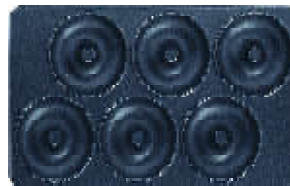
Plaque n° 11 Beignet/donuts