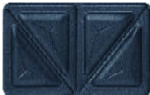
Plaque n° 01 croque monsieur

Si vous pensez qu'il serait plus pratique d'avoir deux appareils dans ce type dans la malle, n'hésitez pas à nous le faire savoir. Idem si d'autres types de plaques vous intéressent.