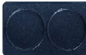
Plaque n° 10 pancake