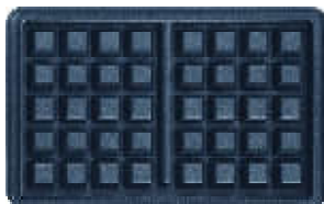
Plaque n° 04 Gaufre