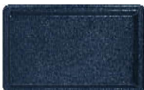
Plaque n° 09 Pain perdu