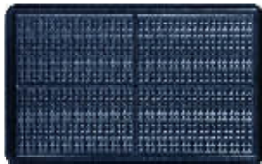
Plaque n° 05 Gaufrette