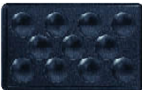
Plaque n° 12 Mini bouchée