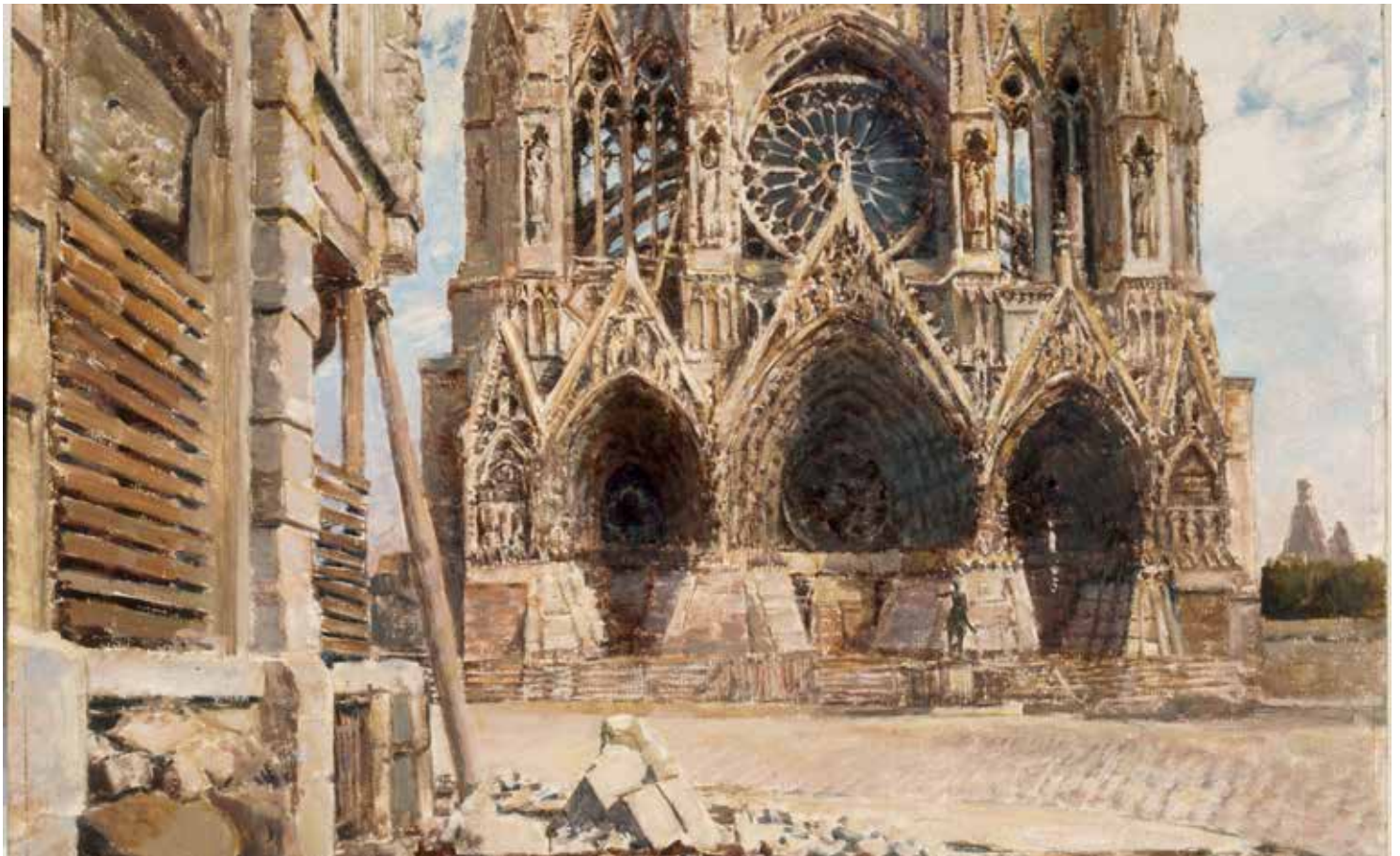
Joseph-Félix Bouchor, La cathédrale de Reims , 1917 – huile sur bois, Musée franco-américain du Château de Blérancourt