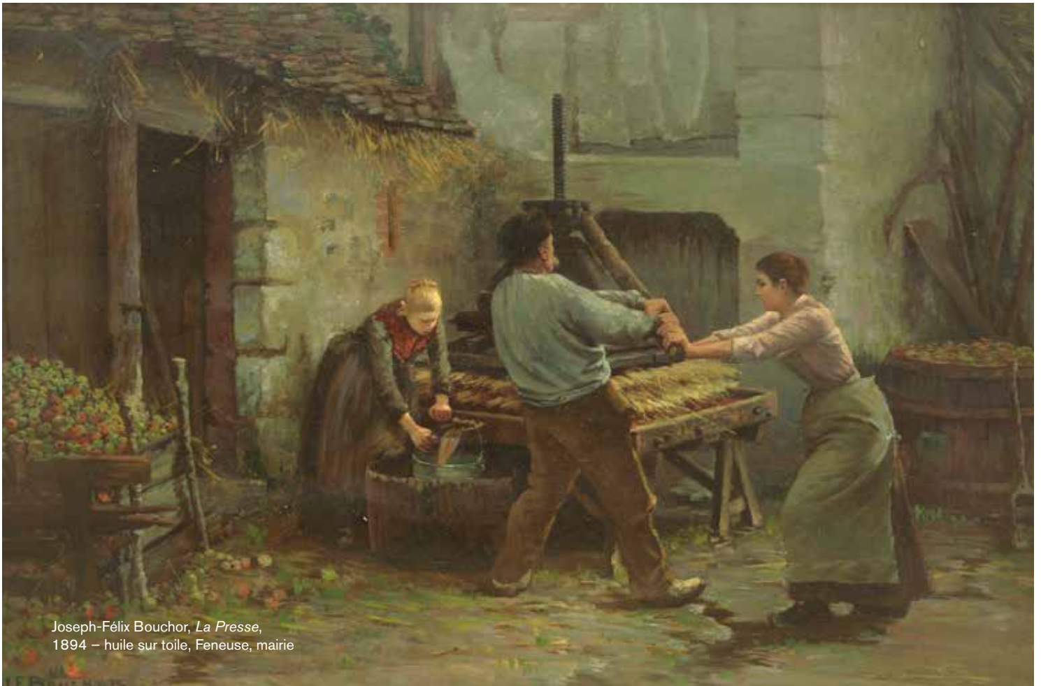
Joseph-Félix Bouchor, La Presse , 1894 – huile sur toile, Feneuse, mairie