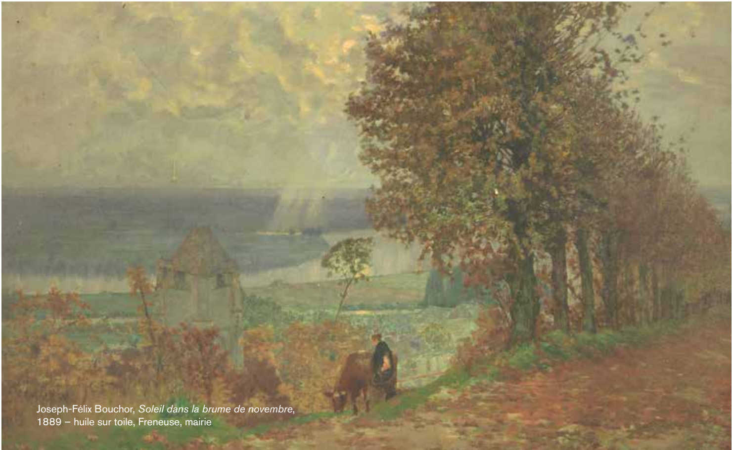
Joseph-Félix Bouchor, Soleil dans la brume de novembre , 1889 – huile sur toile, Freneuse, mairie