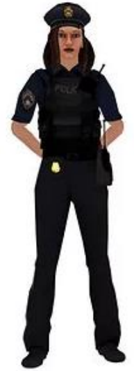
AGENT DE SECURITE