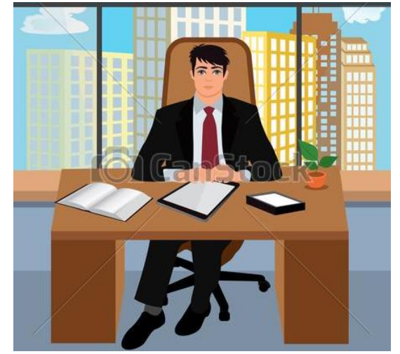
CADRE / PDG