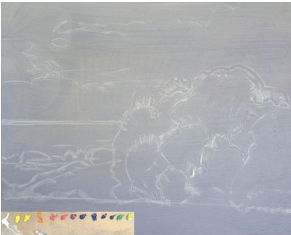
Le dessin de base transféré sur l'imprimature de la toile.