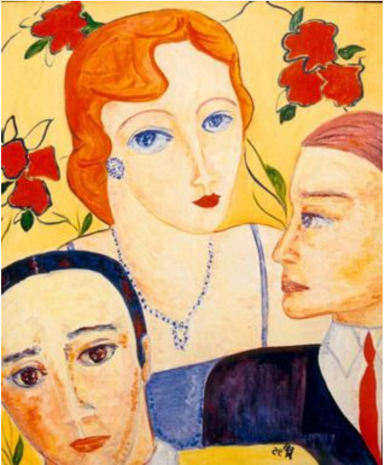
© Nicole Caplain | Dualité | Huile sur toile