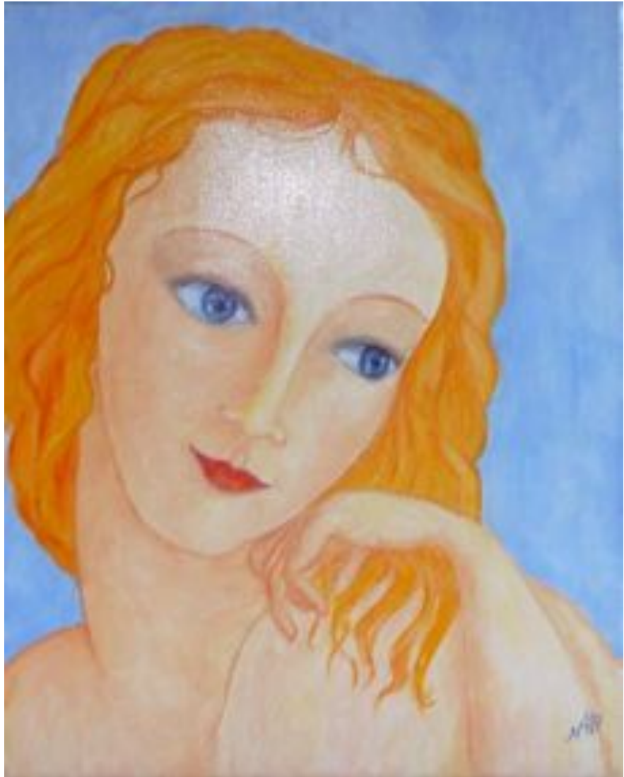
© Nicole Caplain | Le Portrait de Vénus | Huile sur toile

Nombre de ses toiles sont acquises par des communes, des entreprises et des particuliers.