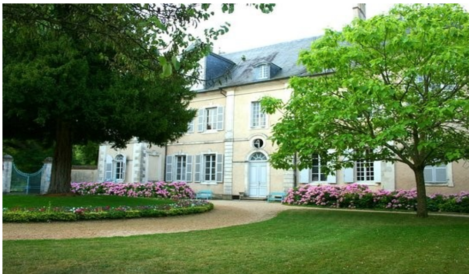
Maison de George Sand à Nohant – Vic (36)