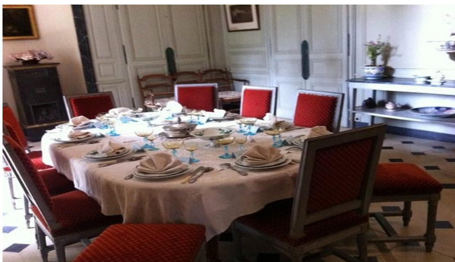
La salle à manger de Nohant – Imaginez les repas de Léondine et George Sand