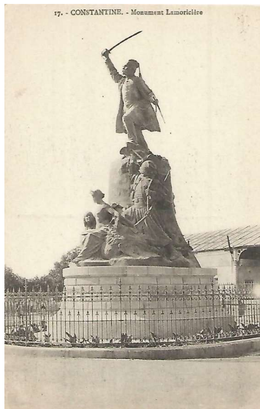
Le 21 juin 1914, à Koléa, inauguration du monument en hommage au général