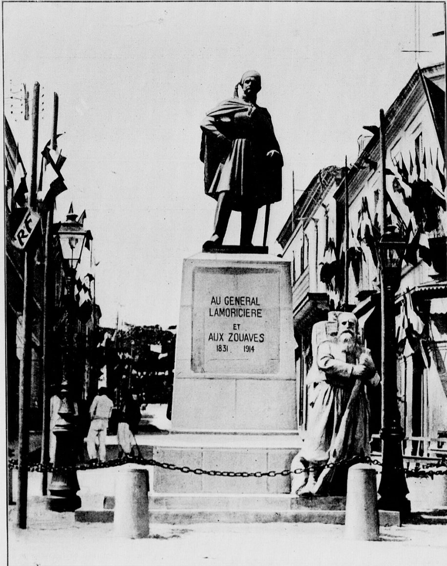
HOMMAGE RENDU A LA MÉMOIRE DU GÉNÉRAL LAMORICIERE. — Sa statue fut inaugurée dimanche 21 juin, à Kola, où les zouaves tiennent garnison.

L'Afrique du Nord illustrée du 27 juin 1914