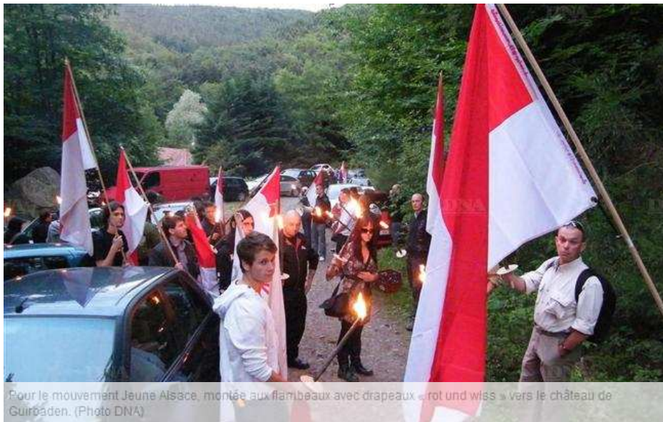
Pour le mouvement Jeune Alsace, montée aux flambeaux avec drapeaux « rot und wiss » vers le château de Guirbaden.

Un collectif de gauche a empêché samedi soir des jeunes autonomistes de tenir leur rassemblement annuel qui était prévu au château du Birkenfels. Jeune Alsace s'est replié sur le Guirbaden.