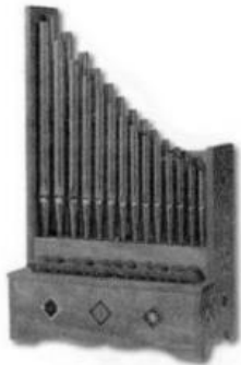
Orgue portatif ou

Cet ouvrage donne une description très exacte des diverses danses de société en y ajoutant de précieux exemples musicaux : grâce à lui, ces danses nous sont connues dans leur chorégraphie d'origine.