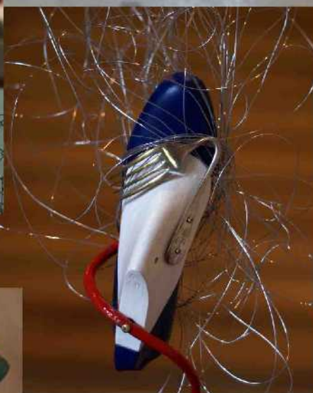
Allégorie d'une société.