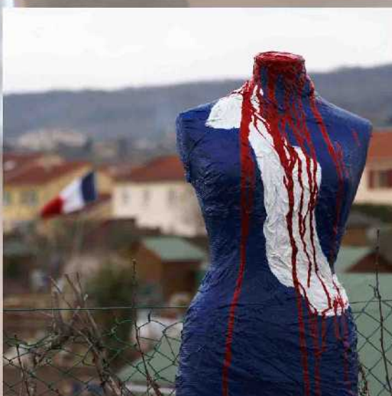
Allégorie de la fuite des entreprises.