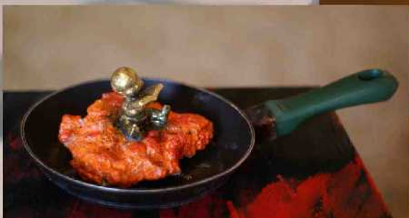
Allégorie du «Yellow cake»