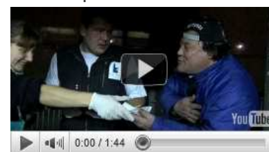
Abribus reprend ses tournées

Vidéo sur la venue d'Edwy Plenel et de Fabrice Arfi à Strasbourg