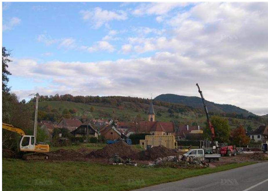
Une nouvelle petite zone industrielle est en cours avec rue du Giessen à Triembach-au-Val.

La commune de Triembach-au-Val a permis la vente de terrains destinés à faire aboutir deux projets au lieu-dit « Sichelmatten » : celui de l'entreprise Sani-Chauffe de Hohwarth, et celui de SCI Funéval de Sélestat.