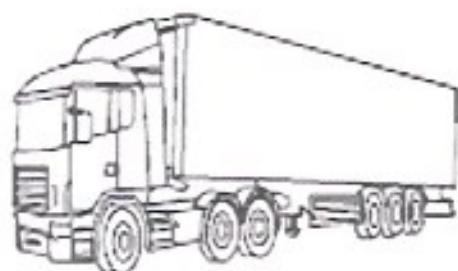
LE CAMION-le camion-le camion