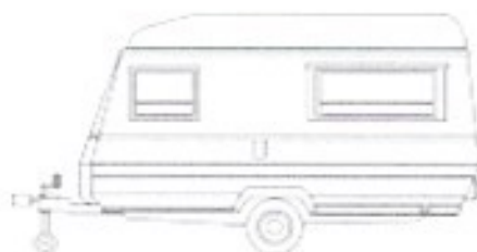
LA CARAVANE-la caravane-la caravane