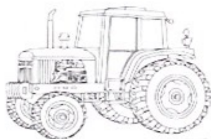
LE TRACTEUR-le tracteur-le tracteur