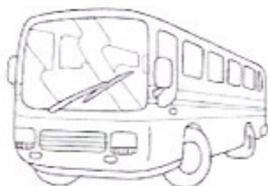
LE BUS-le bus-le bus