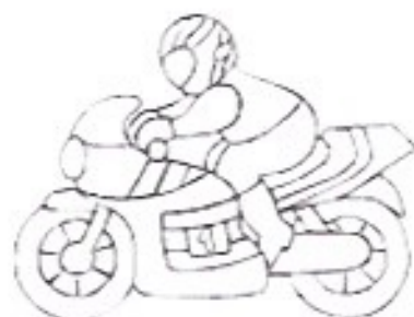
UNE MOTO-une moto-une.....