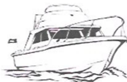
UN BATEAU-un bateau-un bateau