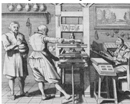
Atelier d'imprimeur au XV e siècle.

A la Renaissance , vers 1450, un homme du nom de Gutenberg, perfectionne une invention et permet d'imprimer du texte et des illustrations en même temps. Ce mécanisme permet de produire beaucoup plus de livres et de faire connaître des auteurs qui ne sont pas liés à la religion.