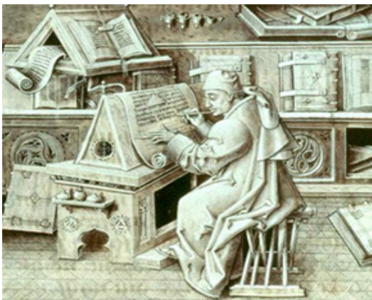
Moine copiste au Moyen Age (gravure).

La plupart des ouvrages étaient la copie de textes religieux, mais il y avait aussi des livres de mathématiques, de sciences et des livres sur les lois.