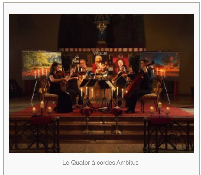
Le Quatuor à cordes Ambitus