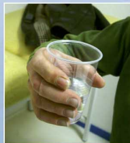
Ce type de prothèse permet de rétablir une fonction dans de nombreux cas.