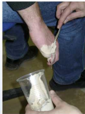
Moulage en silicone