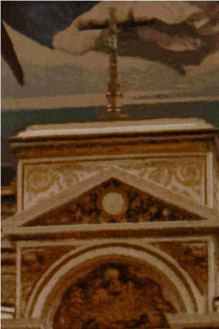
ISO 6400 (luminance 70)