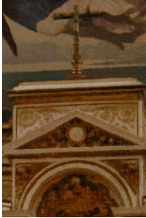
DxO Luminance 40