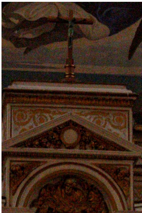
DxO Luminance 100