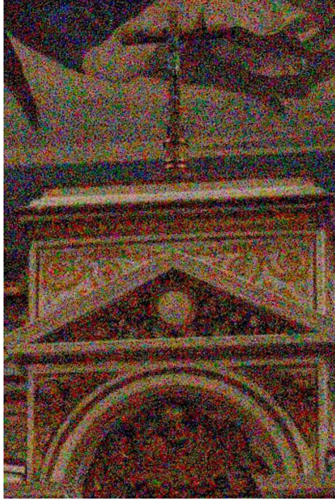
Développée Sans Traitement du bruit