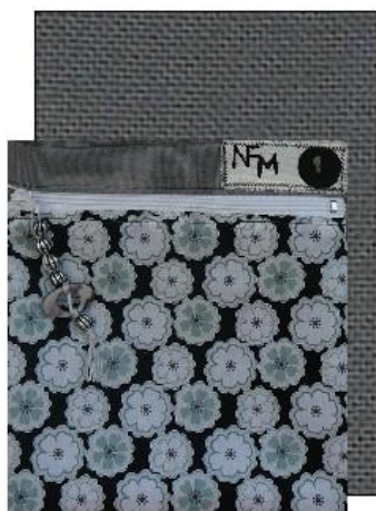
assemblage poche avec face Devant