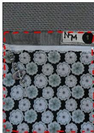
surpiquer à 0,5cms du bord