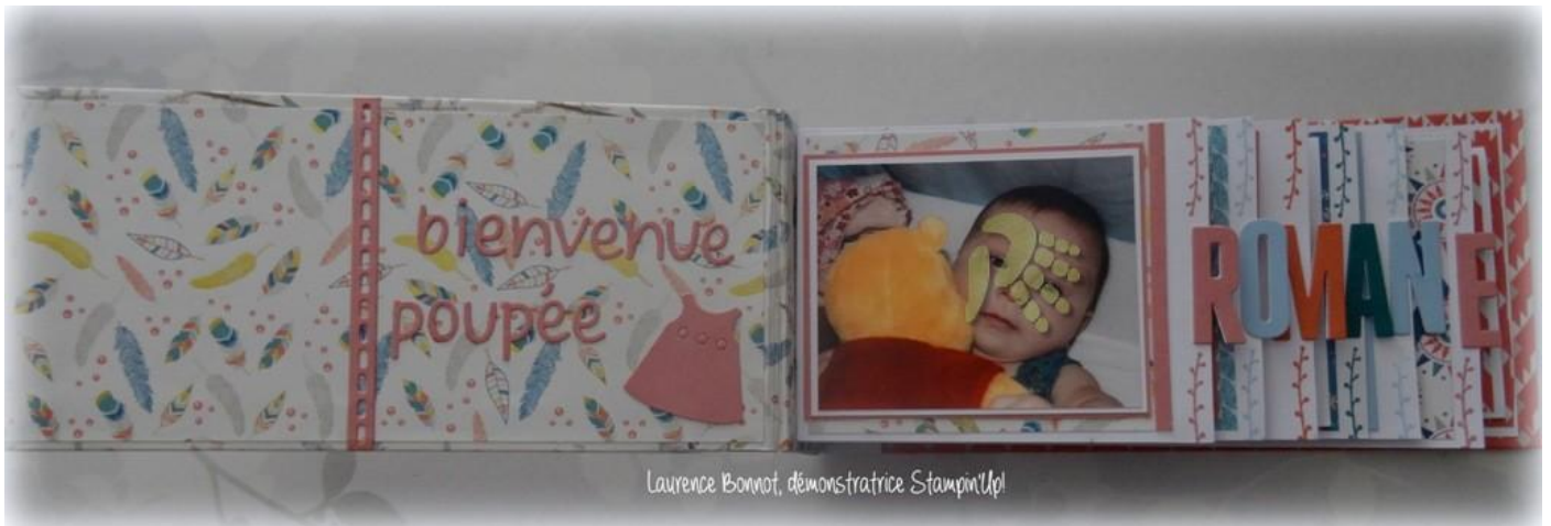
Laurence Bonnot, démonstratrice Stampin'Up!

Recouvrir l'intérieur gauche de la couverture (vous avez un espace de 5 mm sur le dos de couverture c'est normal, c'est pour avoir de l'épaisseur si vous avez de la déco 3d) avec un imprimé