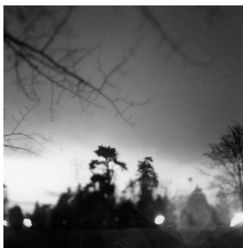
Israel Ariño, Un jardin à Vitré