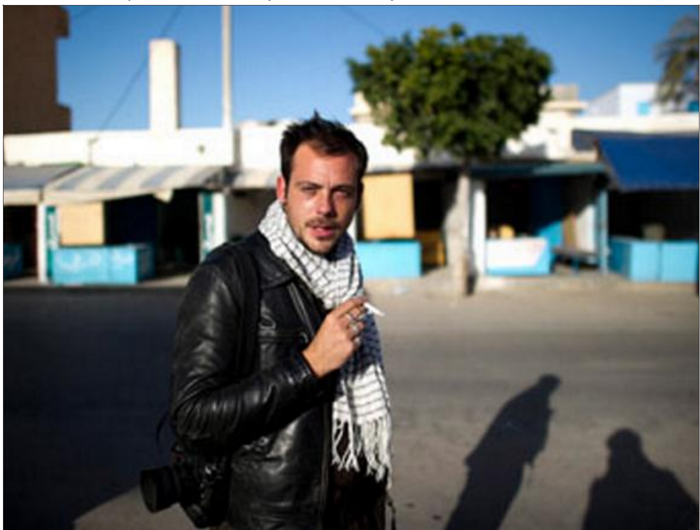
Rémi Ochlik avait 28 ans. Son métier : photographe de guerre. Le jeune Mosellan a été tué le 22 février 2012 en Syrie, alors qu'il couvrait le calvaire des habitants de Homs, ville bombardée sans relâche depuis près de 20 jours par le régime el-Assad.

Sur les circonstances du drame, le 22 février 2012, le voile s'est un peu levé depuis un an. Aïnsi apprend-on, de source syrienne, que Rémi, déjà en Syrie pour Paris Match avec un