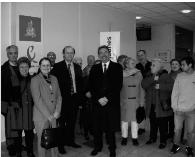
Visite du site eysinois des Pages Jaunes - Janvier 2006

Un des groupes, en présence du député et du responsable de publication des annuaires.