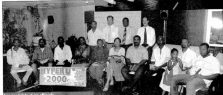
Les candidats et les officiels.