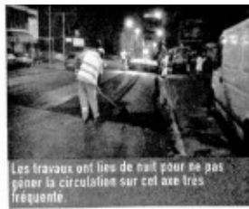
Les travaux ont lieu de nuit pour ne pas gêner la circulation sur cet axe très fréquenté.

Ces infrastructures routières réalisées par le Conseil régional ont nécessité un investissement de 12 millions d'euros. Pour 6 millions d'euros supplémentaires, la prochaine étape sera la réalisation de la voie reliant le Quai