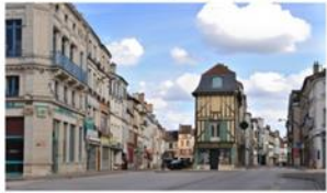
Club photographique à Bar-sur-Aube 10200