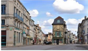
Club photographique à Bar-sur-Aube 10200