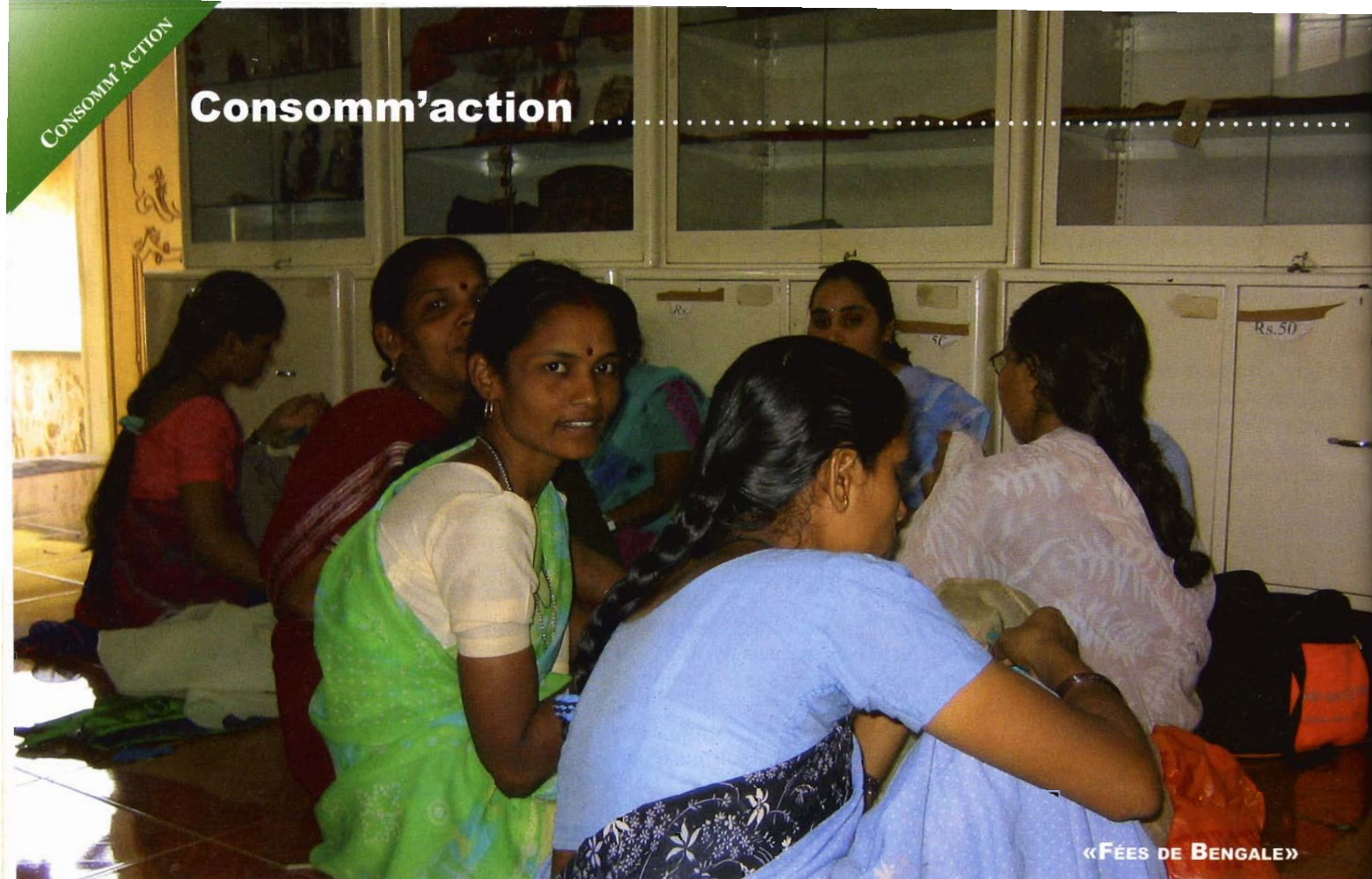
«FÉES DE BENGALE»