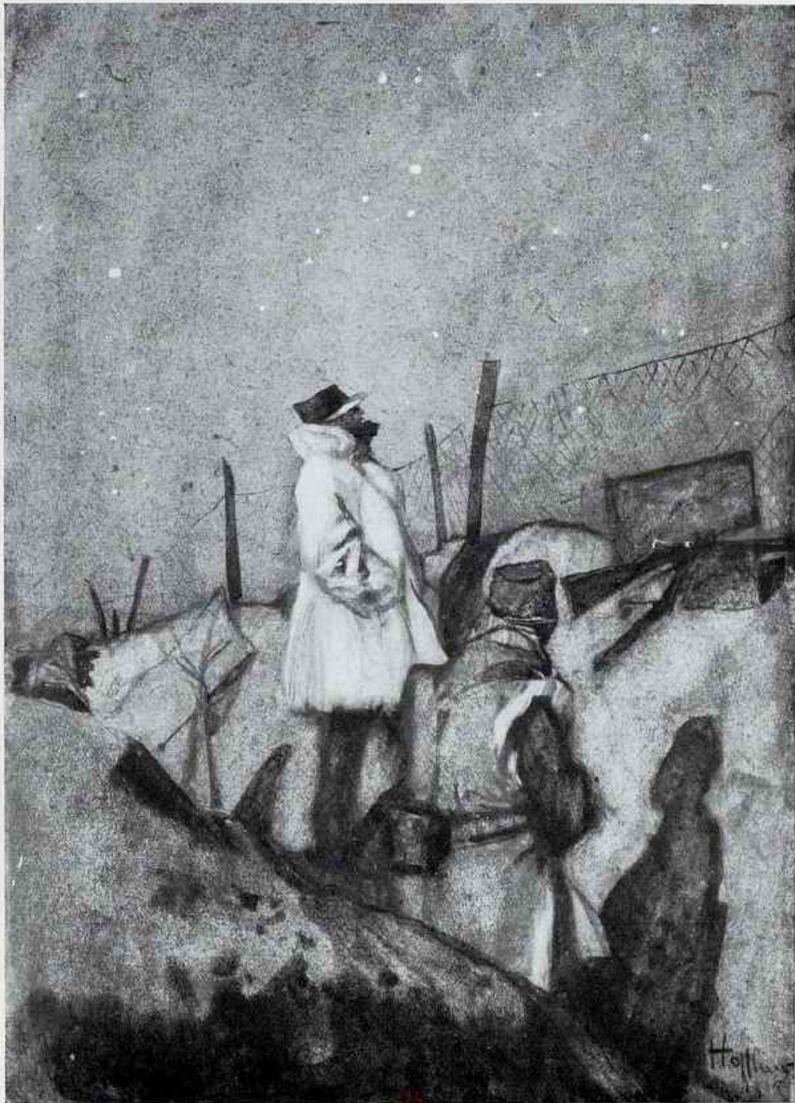
CHARLES HOFFBAUER — AU CLAIR DE LUNE DANS LES TRANCHÉES D'AVANT-POSTE (AQUARELLE ORIGINALE)

Dans la lettre accompagnant cet envoi, l'artiste parle des énormes marmites qui tombaient dans les tranchées alors qu'il peignait cette belle et curieuse aquarelle. « Excusez sa qualité médiocre, ajoute-t-il : j'avais trop de distractions! »