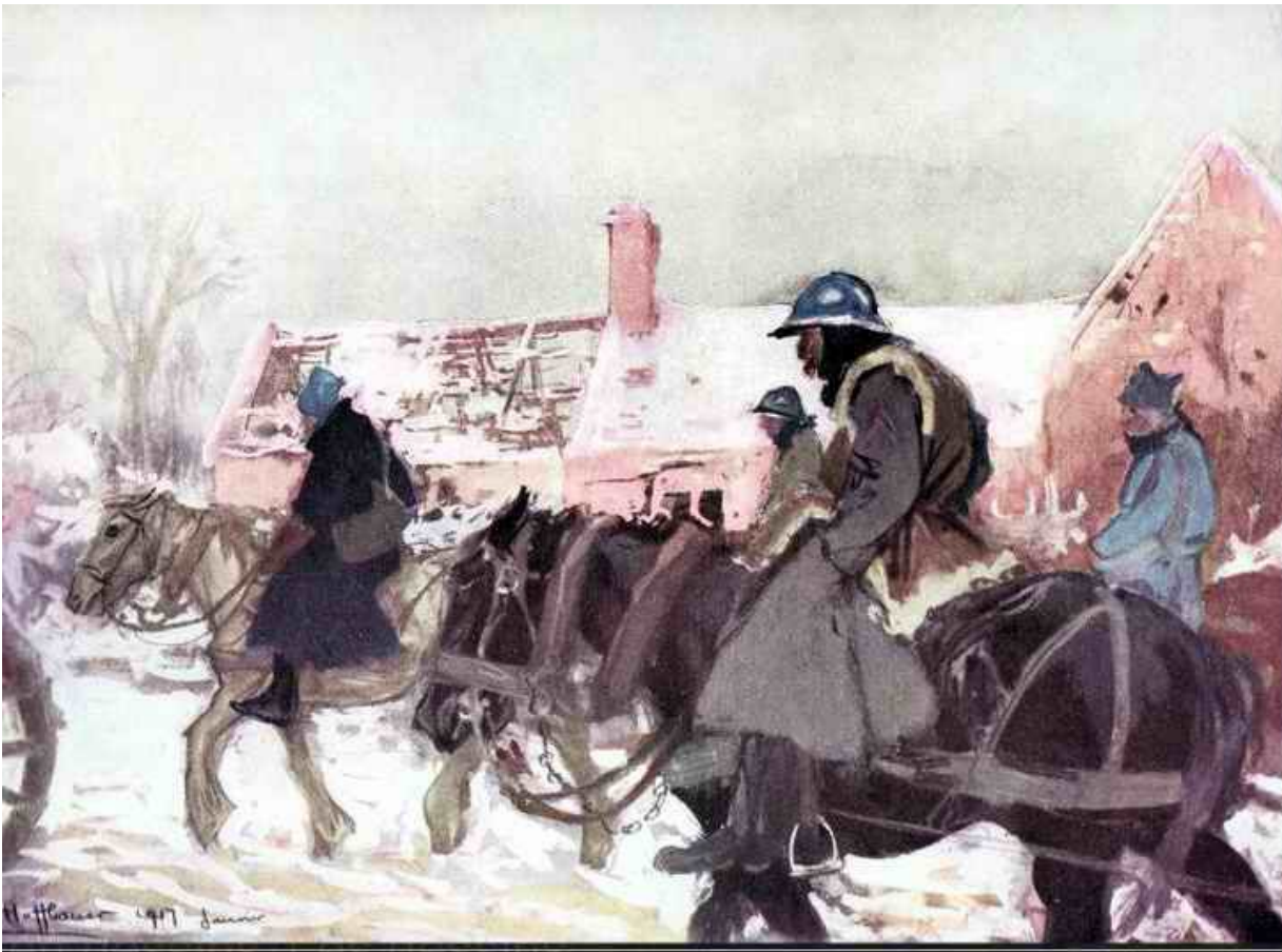
Convoi d'artillerie de Charles Hoffbauer