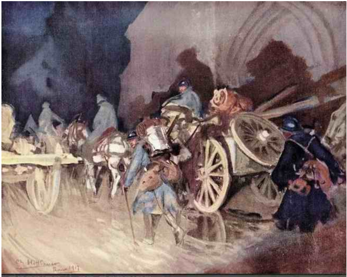
Relève d'infanterie de Charles Hoffbauer